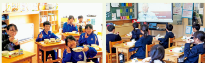
神石高原ランチを食べる児童の様子